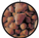
Engrais de 1 ère qualité