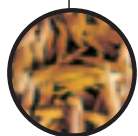
Semences de 1 ère qualité