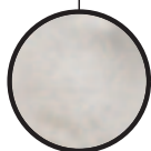
Fibres de cellulose