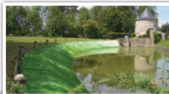
Viresco® en phase de germination sur une berge